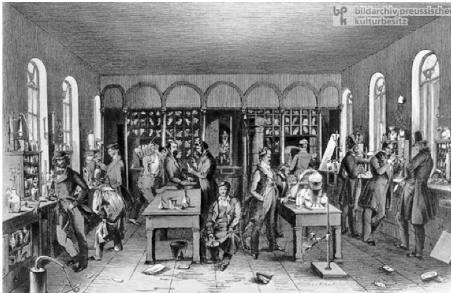
Fig 3. Il laboratorio di Gissen dal repertorio iconografico di German Historical Institute.

I colori sono stati aggiunti in modo arbitrario ai vestiti e alle sostanze con l'effetto di rendere irreali la scena; inoltre l'immagine è stilisticamente impoverita. Il tratto diventa seriale, essendo copia dell'originale e molte sono le assenze e i cam-