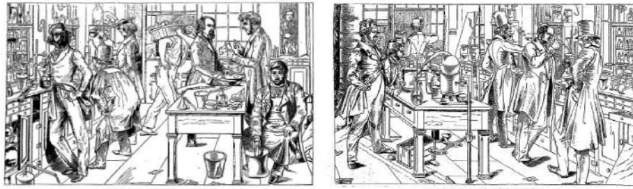
Fig. 2. Il laboratorio di Gissen riprodotto nell'opera di F. Schlödler.

La fama del laboratorio si tradusse in una ripresa della celebre immagine ma accompagnata da variazioni e modifiche, da aggiunte (come il colore) e da omissioni. Una prima riproduzione la troviamo nell'annuario illustrato a opera di Friedrich Schlödler del 1875 [5]. Sono dedicate ventisette pagine al laboratorio di Gissen, e tra di esse troviamo la riproduzione del laboratorio di Liebig ma spezzato e collocato su due pagine differenti. Inoltre va segnalato che sono le uniche immagini dell'interno di un laboratorio e della vita che in esso si svolge; il resto delle immagini sono tavole di piante e sezioni di edifici 2 .