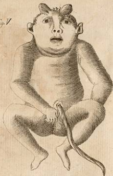
Mostro Pavese ridotto al terzo veduto in faccia.