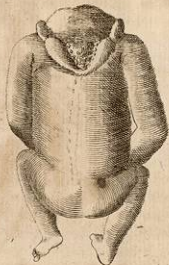
Lo stesso mostro veduto da tergo.