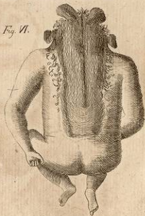
Lo stesso veduto da tergo.