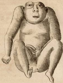
Mostro Padovano ridotto al terzo della sua grandezza veduto in faccia.